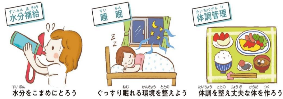
すいぶん ほ けいじょう 水分をこまめにとろう すい かん ぐっすり眠れる環境を整えよう たいちよう ととの じょうぶ からだ つく 体調を整え丈夫な体を作ろう

ねつちゅうしょう はじ きゅう あつ ひ で あつ な からだ 5月は熱中症シーズンの始まり。急に暑い日が出てきて、暑さに慣れていない体がつい ていけず、熱中症になりやすい時期です。暑さに負けない体づくりをはじめましょう！