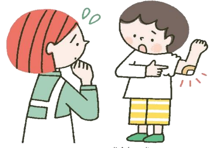
ばんそうこうやシップは自宅で替えてこよう