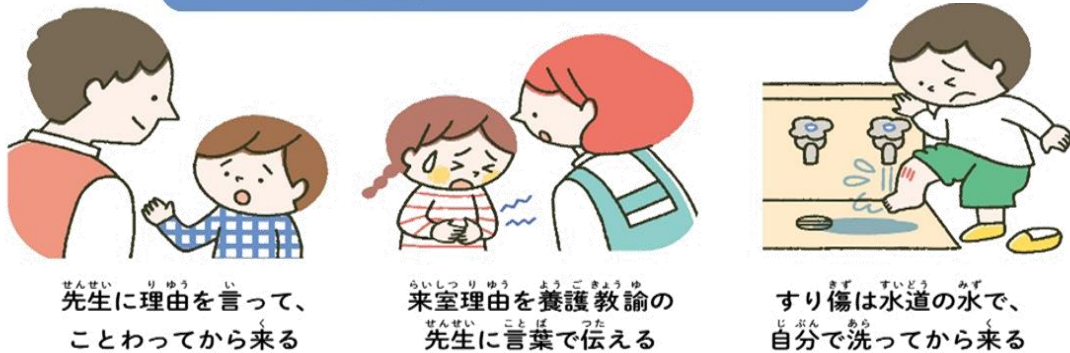
先生に理由を言って、 ことわってから来る