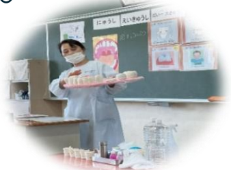
けやき学級での様子。大きな歯の模型を使って説明しています。

6月13日(土)学校公開日に、けやき学級・1・2年生に対し、歯科衛生士さんによる歯科保健指導がありました。その様子を少しご紹介します。